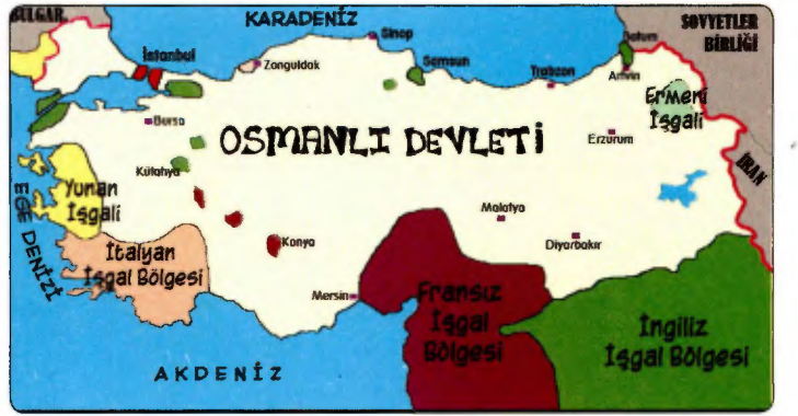
I. Dünya Savaşı Sonrası Osmanlı Devleti

Yukarıda I. Dünya Savaşı'nın öncesine ve sonrasına ait Osmanlı Devleti'nin haritası verilmiştir.