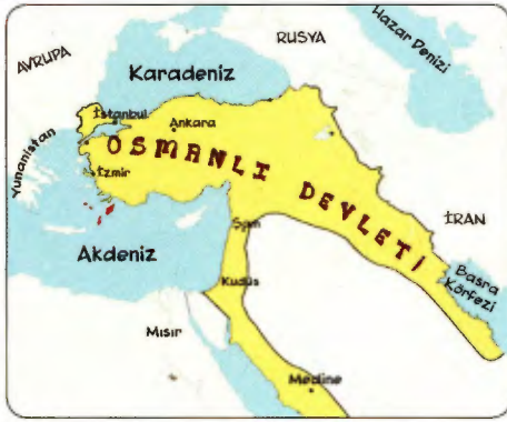
I. Dünya Savaşı Öncesi Osmanlı